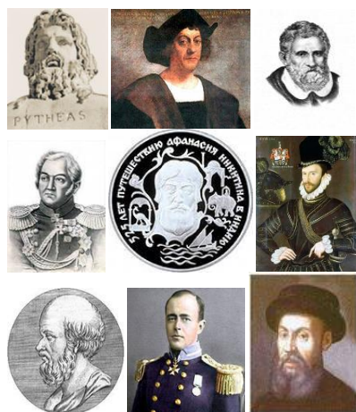
Филворд 1. «Ұлы саяхатшылар»

«Жер туралы мәліметтердің дамуы. Ұлы географиялық ашылулар» тақырыбынан кейін сыныпты 2-3 топқа бөліп, «әріптік лабиринт» немесе «Ұлы саяхатшылар» филвордын шешуге ұсынға болады. Бұл тапсырманы орындау үшін зейіннің тұрақтылығы қажет. Тапсырмада берілген терминдерді еске түсіре отырып оқушылардың есте сақтау қабілеті мен зейіні дамытады. Жасырылған сөздерді тапқан соң оқушылар суреттегі саяхатшылармен сәйкестендіреді.